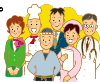
ご紹介謝礼額 (なかのハート商品券)